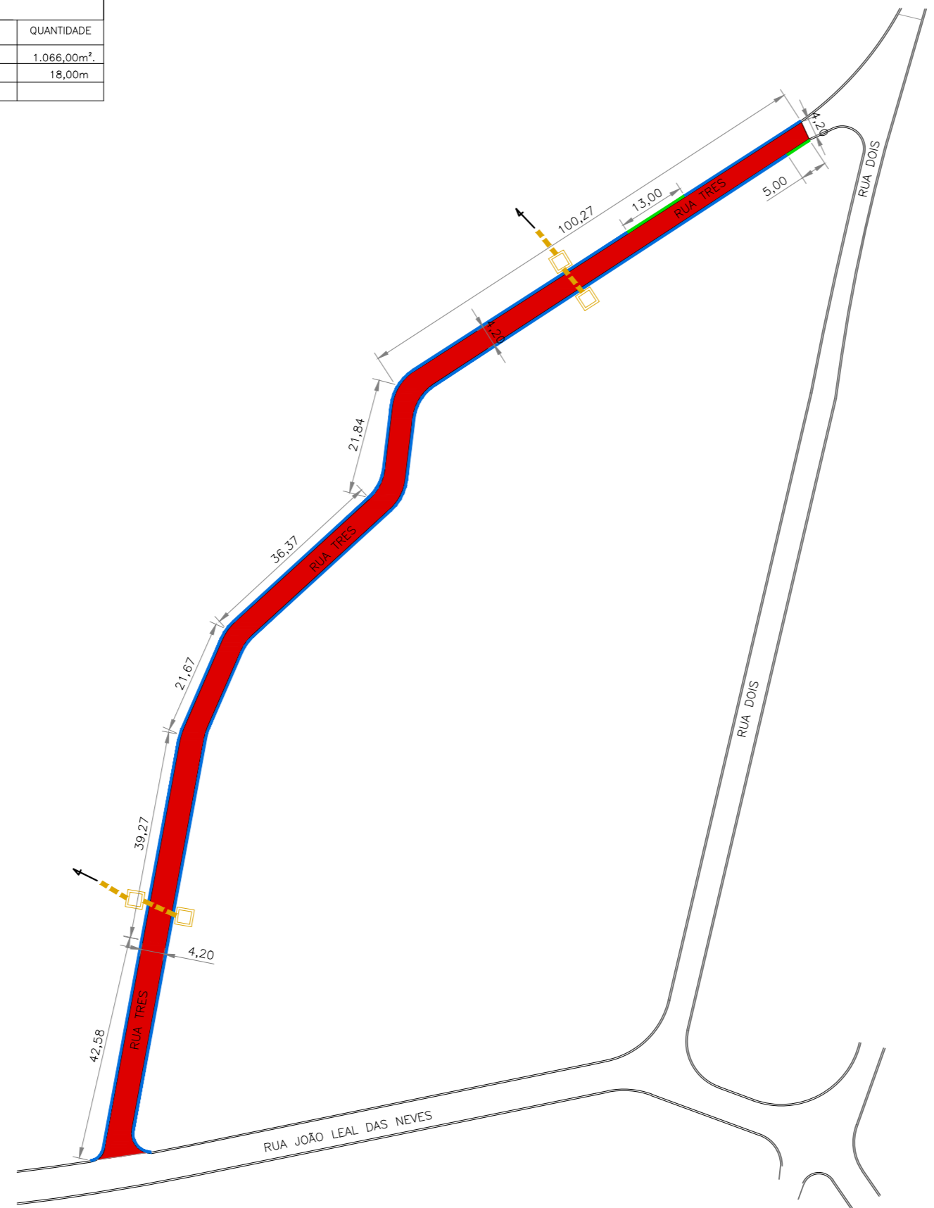
PLANTA BAIXA Escala 1:100