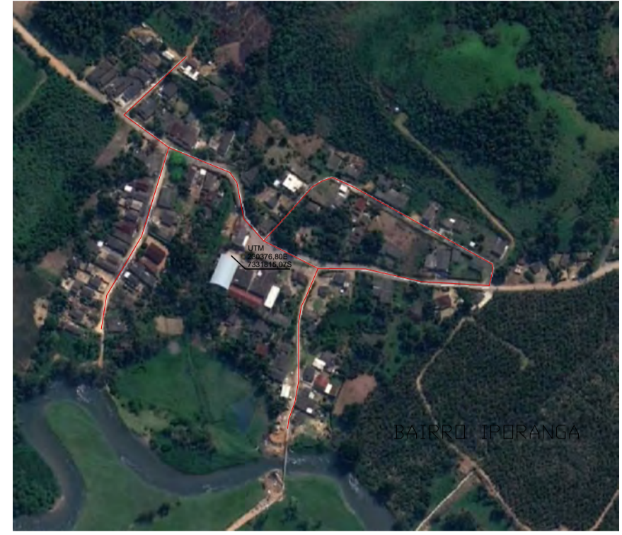
PLANTA DE LOCALIZAÇÃO S/ESCALA